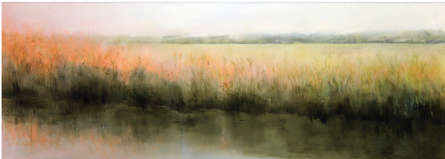
Cristina Díaz García Orilla . Acrílico sobre tabla, 50 x 140 cm.