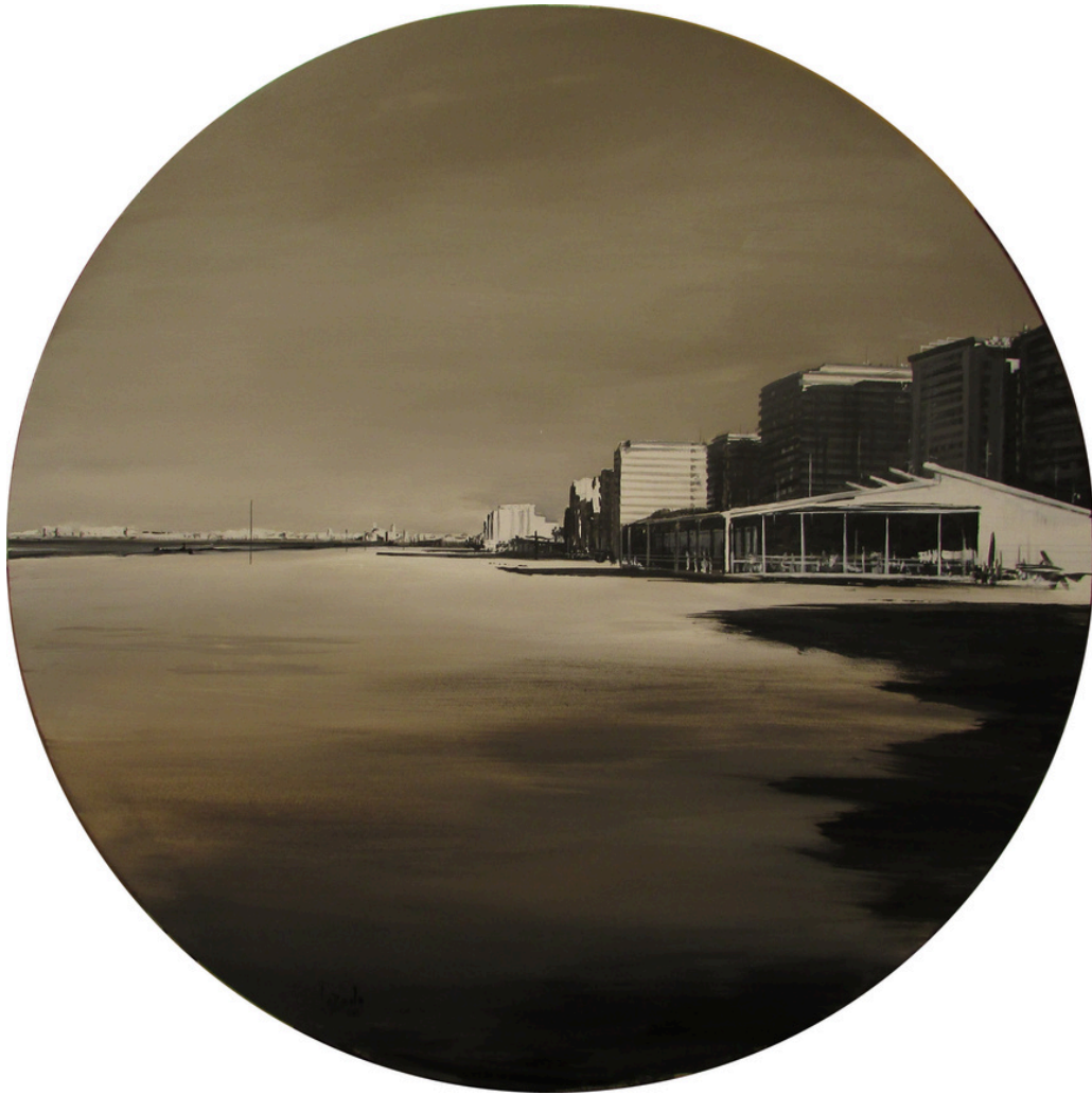
Manuel Fernández Lozano Playa Victoria. Marzo. Técnica mixta sobre lienzo, 90 x 90 cm.