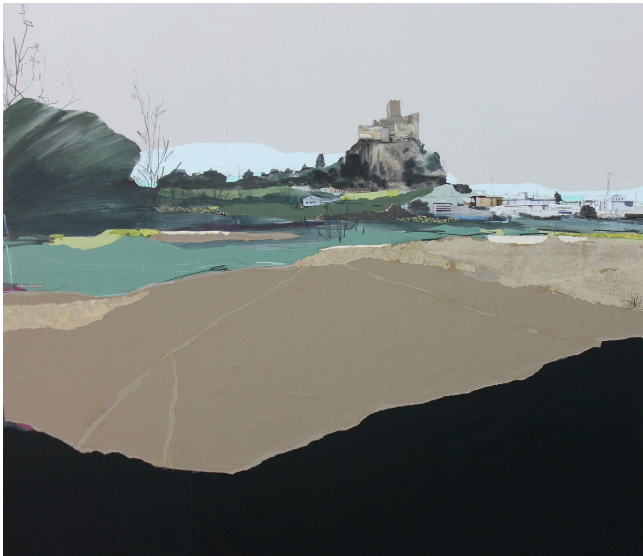
Eduardo Gómez Query Paisajes heredados . Mixta sobre tabla, 87 x 100 cm.