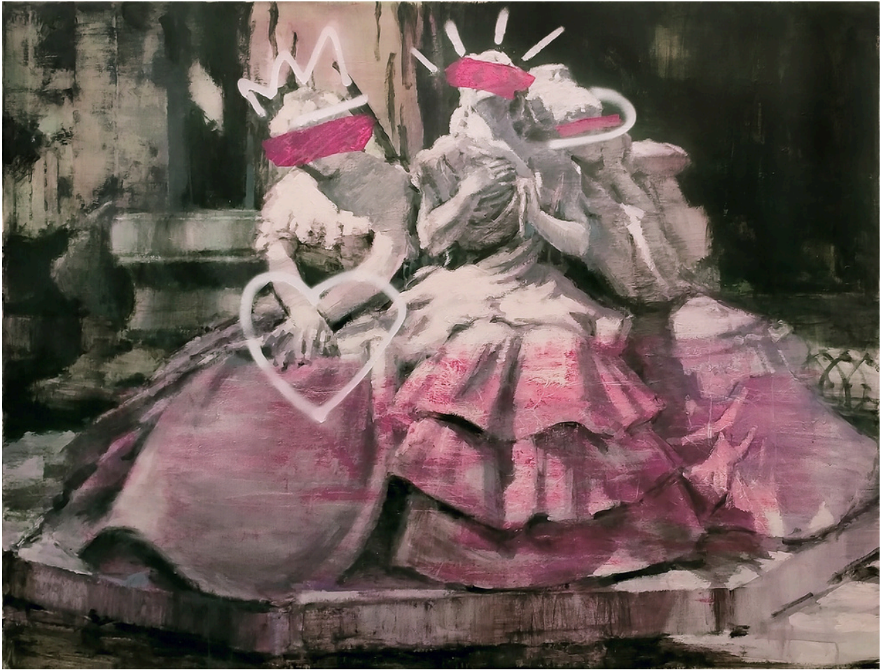
Miguel Bastante Recuerda El amor ilusionado, el amor poseído y el amor perdido de Bécquer. Técnica mixta, 150 x 114 cm