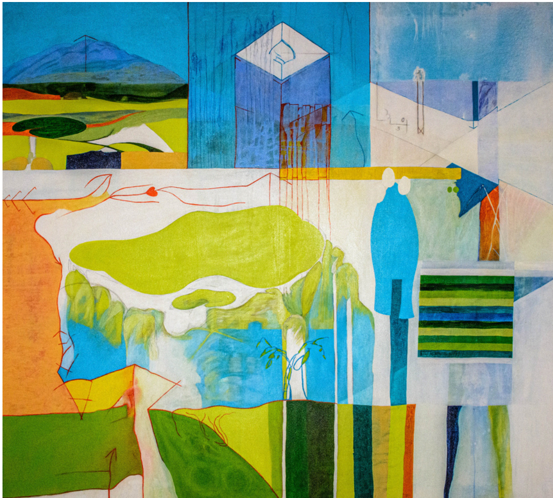
Francisco Ceballos Barón La Muela 3x21, un relato tricrómico. Acrílico sobre lienzo, 145 x 131 cm.